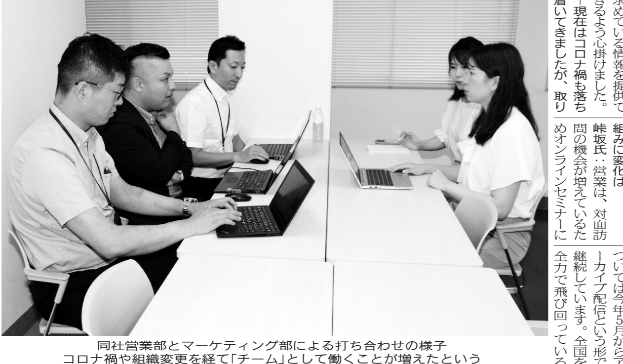
同社営業部とマーケティング部による打ち合わせの様子。コロナ禍や組織変更を経て「チーム」として働くことが増えたという

求められている情報を提供できるように心がけました。現在ねじのコロナ禍も落ち着いてきましたが、取り組みに変化は