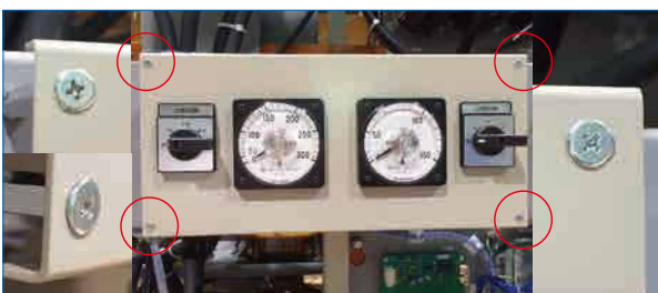
【周波数変換器】株式会社YAMABISHI様