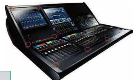
【ミキサー】ローランド株式会社様