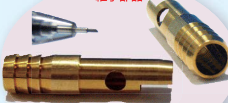
複合機による横穴加工